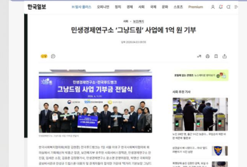
민생경제연구소 '그냥드림' 사업 기부금 전달식 보도자료